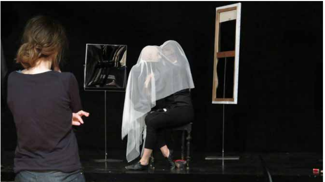
Répétition au Clastic Théâtre, 2017