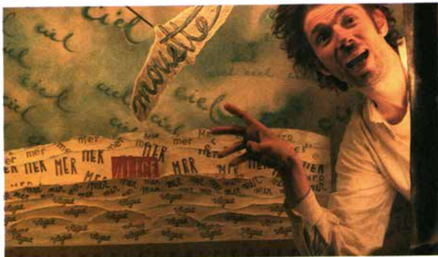
« Alice au pays des lettres », une adaptation libre et délicate.

À partir du petit texte écrit par Roland Topor en hommage à Lewis Carroll, Elzbieta Jeznach a imaginé cette version délicate d' Alice au pays des lettres : le voyage d'une fillette de l'autre côté d'une feuille de papier, dans un monde où les lettres parlent et où la grammaire est une autoritaire petite bonne femme acariâtre. Dans cet univers, les parapluies ruissellent d'étranges gouttelettes, les cubes recèlent des trésors et les papas écrivent des missives qu'on attend très longtemps. Un très joli spectacle sur les mots - ceux que l'on dit, ceux que l'on ne dit pas, et ceux que l'on espère que l'on vous dise... Alice au pays des lettres. A partir de 6 ans. Par Elzbieta Jeznach. Du 21 au 28 février. Les mar, ven et sam à 19h, mer à 14h 30. Tarif: 8 €, moins de 12 ans: 6 €. L'Etoile du Nord, 16, rue Georgette-Agutte, Paris XVIII e . Tél.: 01 42 26 47 47 et www.etoiledunord-theatre.com . Le spectacle sera repris au Parquet de bal, les 4 et 11 mars à 19h, les 5 et 12 mars à 15h. Tél.: 01 40 05 01 50.