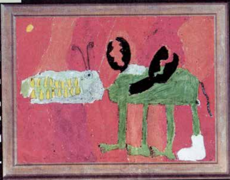
L'un des chefs-d'œuvre d'enfants accumulés par le professeur Galopin, alias Roland Topor.

Ne jetez aucun dessin d'enfant ! Parmi la large production artistique enfantine se cachent certainement un ou plusieurs chefs-d'œuvre qui pourraient échapper à votre sagacité. Pour vous aider à faire le tri, il existe sur cette planète un homme remarquable qui consacre sa vie à comparer et à admirer des milliers de dessins d'enfants,