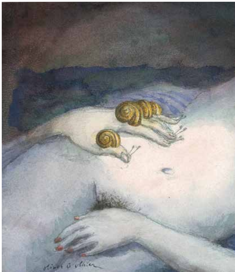
Histoire d'amour, 1991, Olivier O. Olivier

Son visage peut descendre dans mon bas-ventre, mon bras glisser dans sa main comme s'il enfilait un gant. J'ai sa bouche dans mon oreille, ses seins sous mes aisselles. Je les presse doucement, comme ceci, en serrant les coudes contre mes flancs. Ma maîtresse liquide voyage à l'intérieur de mes veines, elle caresse mes viscères, me procurant un plaisir continu, une extase sans fin.