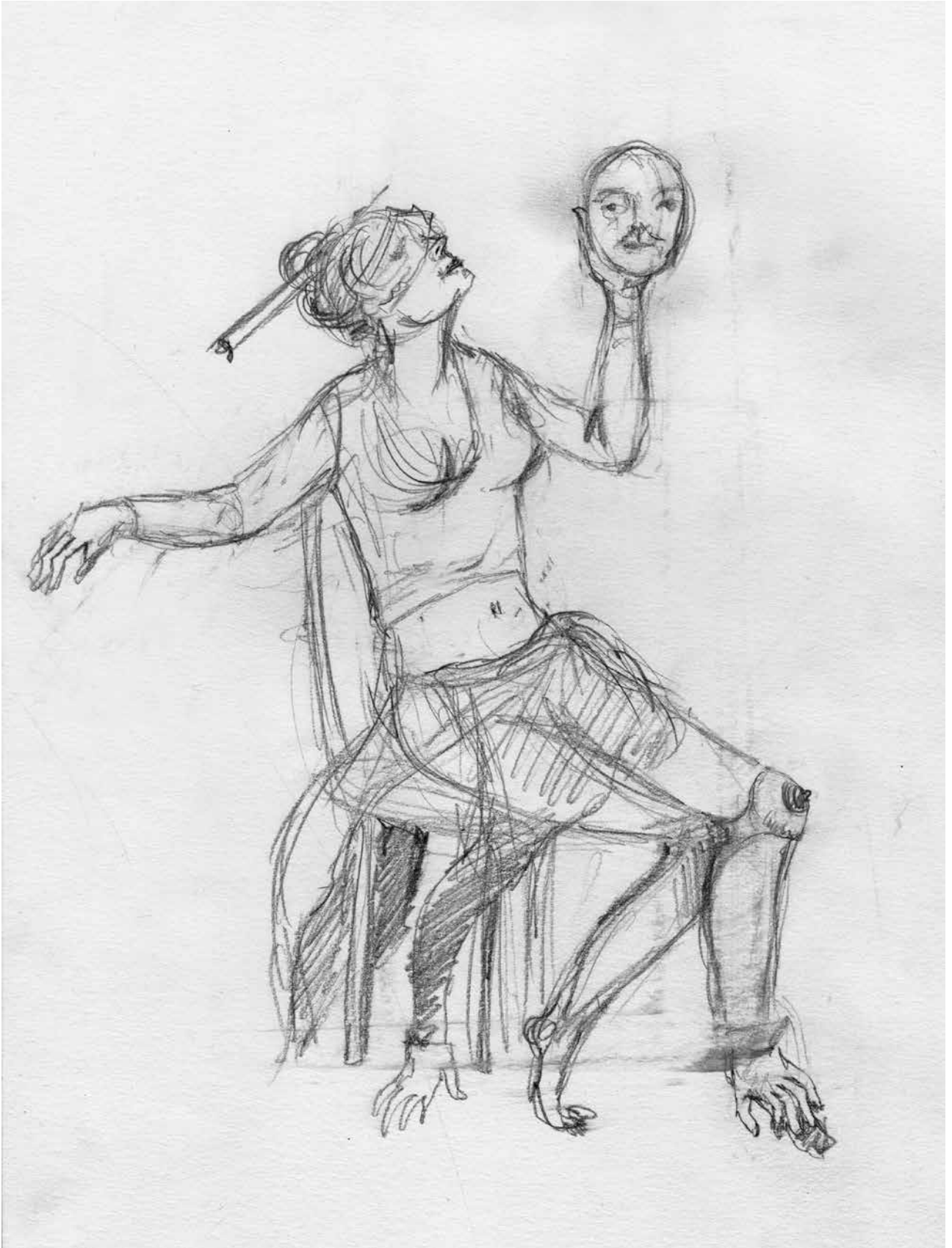
Maquette de Elzbieta Jeznach